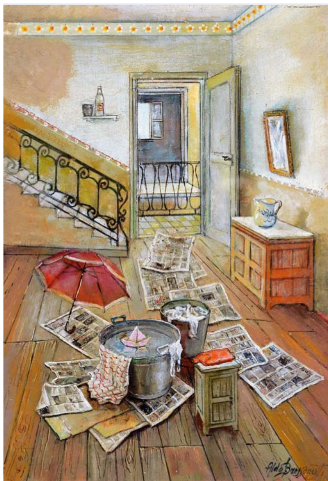
"La barchetta" - 2011 - cm. 33x24