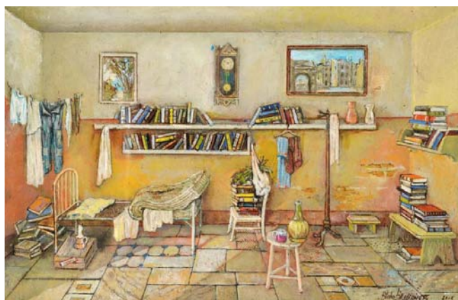
"Libreria" - 2011 - cm. 22x35