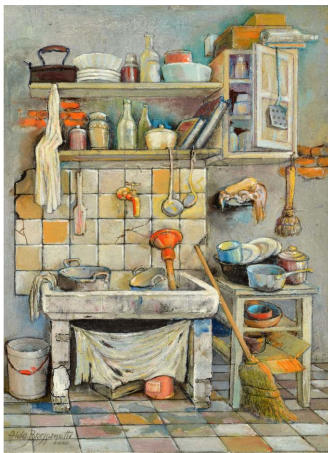
"Scafa" - 2010 - cm. 29x19