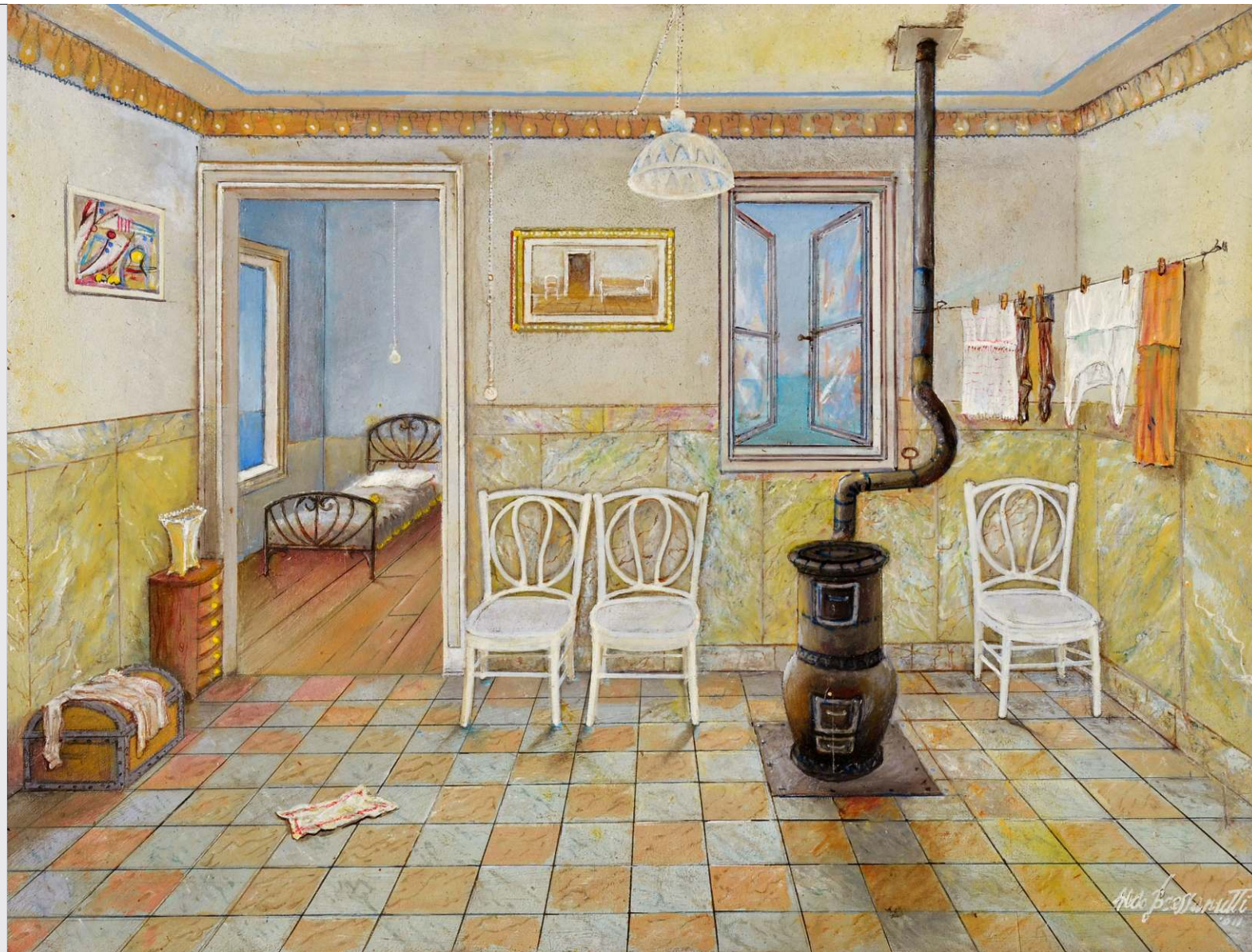
"Il baule" - 2011 - cm. 40x52

Aldo Bressanutti è artista capace di coniugare l'indagine del reale con il sogno introverso e metafisico, eppure solare, e la tenerezza del ricordo, celata dietro cenni ludici e ironici. Nel ritrarre la realtà - in questo caso i memorabili interni autobiografici - il pennello si tinge sovente di una sfumatura poetica, non dichiarata ma latente, che si addolcisce in un originale racconto declinato dal pittore come un apparente divertissement . Asciutto, apparentemente disincantato, in realtà sensibilissimo, il pittore traccia, in particolare nei suoi interni d'infanzia e di esistenza poverissima, un velo