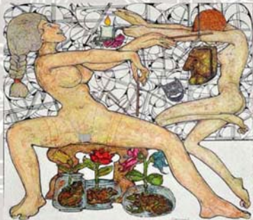
"Ammaestramenti dal sbor" - acquarello e gouache - cm. 80x80

Ivan Bidoli studio: via Dante, 1 - 33050 Fiumicello (UD) 0431 968777 - 333 6509779 www.ivanbidoli.it