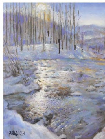
"Ghiaccio sul Carso" olio su tavola—cm 30x23