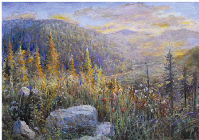
"Dal sentiero di montagna" olio su tela—cm 50x70