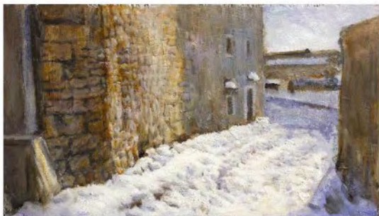
"Neve a Rupin piccolo" olio su tavola—cm 24x40

Ha esposto presso la Galleria Tribbio e la Galleria Comunale a Trieste, la Galleria la Loggia di Udine e a Venezia presso la Galleria Melori&Rosenberg e a Fort Myers, Florida (U.S.A.) presso la National Wildlife Gallery.