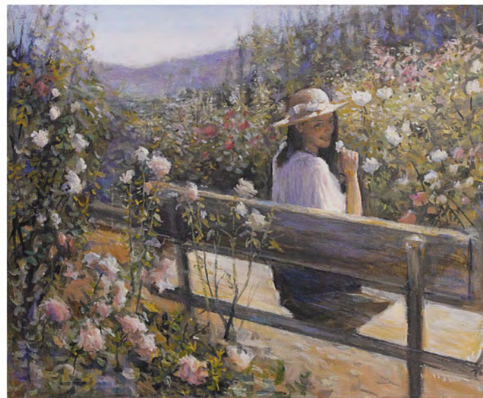
"Roseto" olio su tela—cm. 50x60

Finora - e così in questa rassegna - il percorso è orientato verso un'armonica interpretazione del reale, in cui l'equilibrio